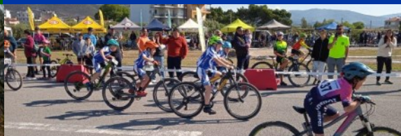
SUPER CUP next generation mountain bike