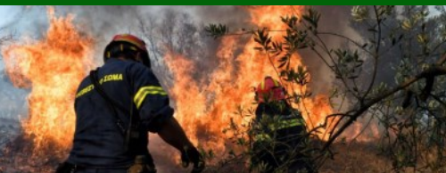
"ΠΥΡΟΠΡΟΣΤΑΣΙΑ" Έναρξη αντιπυρικής περιόδου