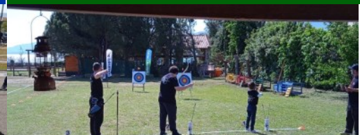
1st LEPANTO ARCHERY CUP From Lepanto archery team